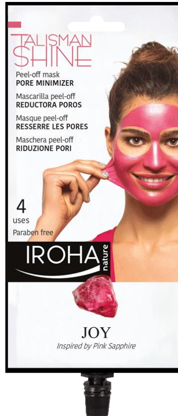
Masque Peel Off RÉDUCTION DES PORES